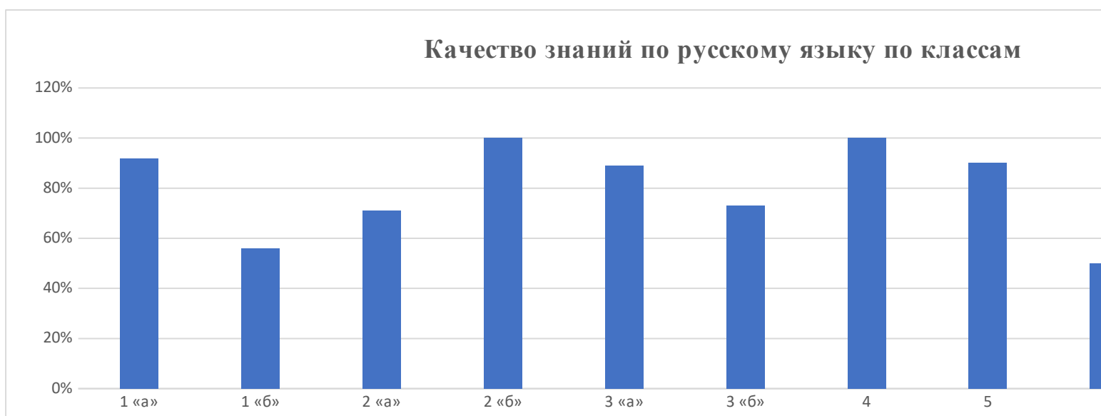
Качество знаний по русскому языку по классам (общая статистика)